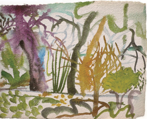
Illustration "vegetation#2": nakaban

作曲家と画家という領域を超えて ともに多くの思考と創造を重ねてきた 阿部海太郎とnakabanが、 牧野富太郎が果たした植物学への ありったけの敬意と可笑しな愛情を込めて 牧野植物園で繰り広げる コンサートとワークショップ。