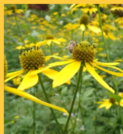
オオハンゴンソウ (キク科)

高さ1~3mになる多年生草本で、明治中頃に園芸植物として渡来したとされています。肥沃で湿った土地に生育し、横走する地下茎から茎を出して群生します。国内では中部地方以北の寒冷な地域で、河川敷や湿原などに繁茂しています。7~9月頃、黄色い花をつけます。