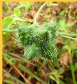
アレチウリ (ウリ科)

つる性の一年草で、輸入大豆に種子が混入して渡来したといわれています。日当りのよい場所を好み、成長速度が早く、長さ数10mになり、地表や他の植物に覆い被さるように成長し、河川敷一面に繁茂することがあります。7~10月頃開花し、秋に刺のある果実をつけます。