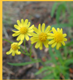
ナルトサワギク (キク科)

1年生または多年生草本で、1976年に徳島県鳴門市で確認され、鳴門沢菊と名づけられました。現在では、西日本を中心に急速に分布域が拡大しています。海辺の埋立地、空地、路傍、河川敷などに生育し、1年を通じて花をつけ、タンポポのように綿毛の付いたタネを飛ばします。