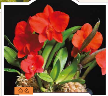
命名 しゅうじゅうらん