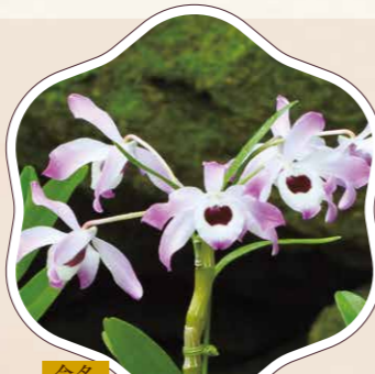
命名 かうきせきこく

園遊会のメインホールでは、ホストである牧野博士が皆さまをお迎えます。博士の応接間には、これまでの3つの間を象徴するランを設えました。きらびやかなメインホールで博士との記念写真をどうぞ。