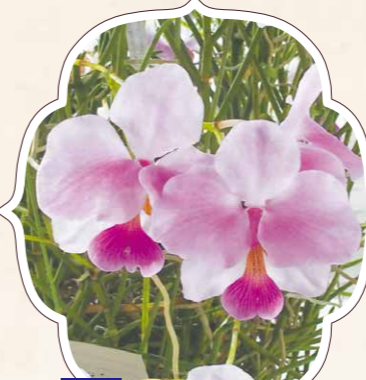
命名 はなぼうらん

まさに宝石のように美しい輝きを放つヒスイランを主役に、クールカラーで引き立てた優美な空間をご堪能ください。