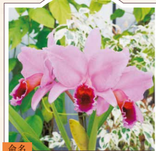
命名 びろうどひのでらん