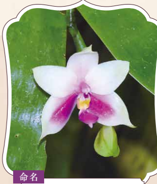
命名 ひろはごてふ

蝶を思わせる美しい花姿から美術品のモチーフなどに用いられてきた胡蝶が、ひとときのロマンティックな世界に誘います。