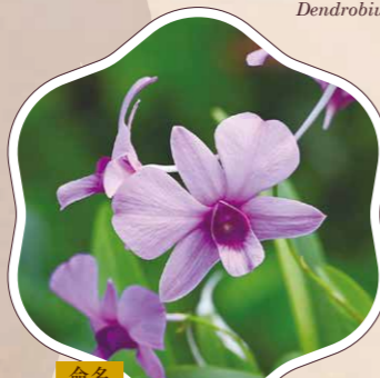
命名 おどめせきこく