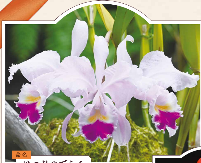
命名 はつひのでらん