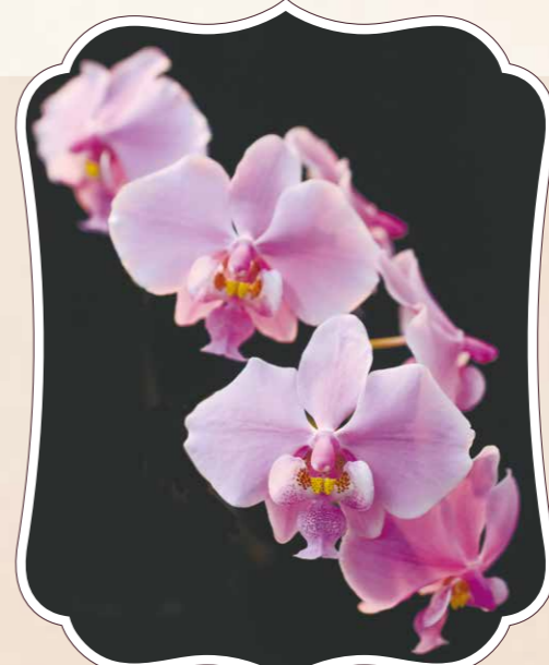
命名 あさひごてふ