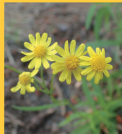
ナルトサワギク (キク科)

1年生または多年生草本で、1976年に徳島県鳴門市で確認され、鳴門沢菊と名づけられました。現在では、西日本を中心に急速に分布域が拡大しています。海辺の埋立地、空地、路傍、河川敷などに生育し、1年を通じて花をつけ、タンポポのように綿毛の付いたタネを飛ばします。