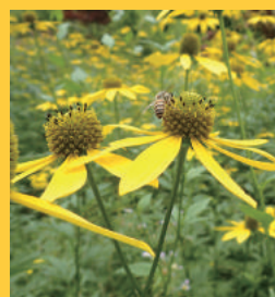
オオハンゴンソウ (キク科)

高さ1~3mになる多年生草本で、明治中頃に園芸植物として渡来したとされています。肥沃で湿った土地に生育し、横走する地下茎から茎を出して群生します。国内では中部地方以北の寒冷な地域で、河川敷や湿原などに繁茂しています。7~9月頃、黄色い花をつけます。