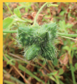
アレチウリ (ウリ科)

つる性の一年生草本で、輸入大豆に種子が混入して渡来したといわれています。日当たりのよい場所を好み、成長速度が早く、長さ数10mになり、地表や他の植物に覆い被さるように成長し、河川敷一面に繁茂することがあります。7~10月頃開花し、秋に刺のある果実をつけます。